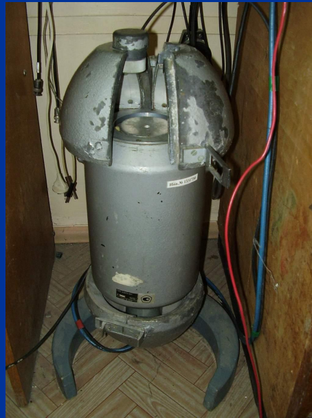
Рис. 4-Детектор гамма –спектрометра и его защита

Для уменьшения фона детектор был окружен свинцовой защитой толщиной 2,5 см.