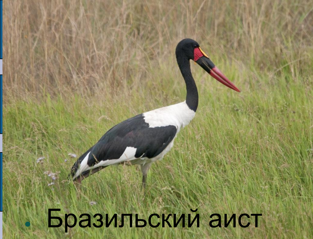
• Бразильский аист