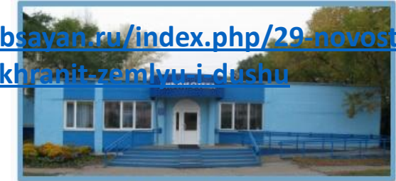
ЭКОВечер "Сохранить Землю и душу"

Главная О ЦБС Читателям Краеведение и туризм Коллегам Информационные ресурсы Карта сайта