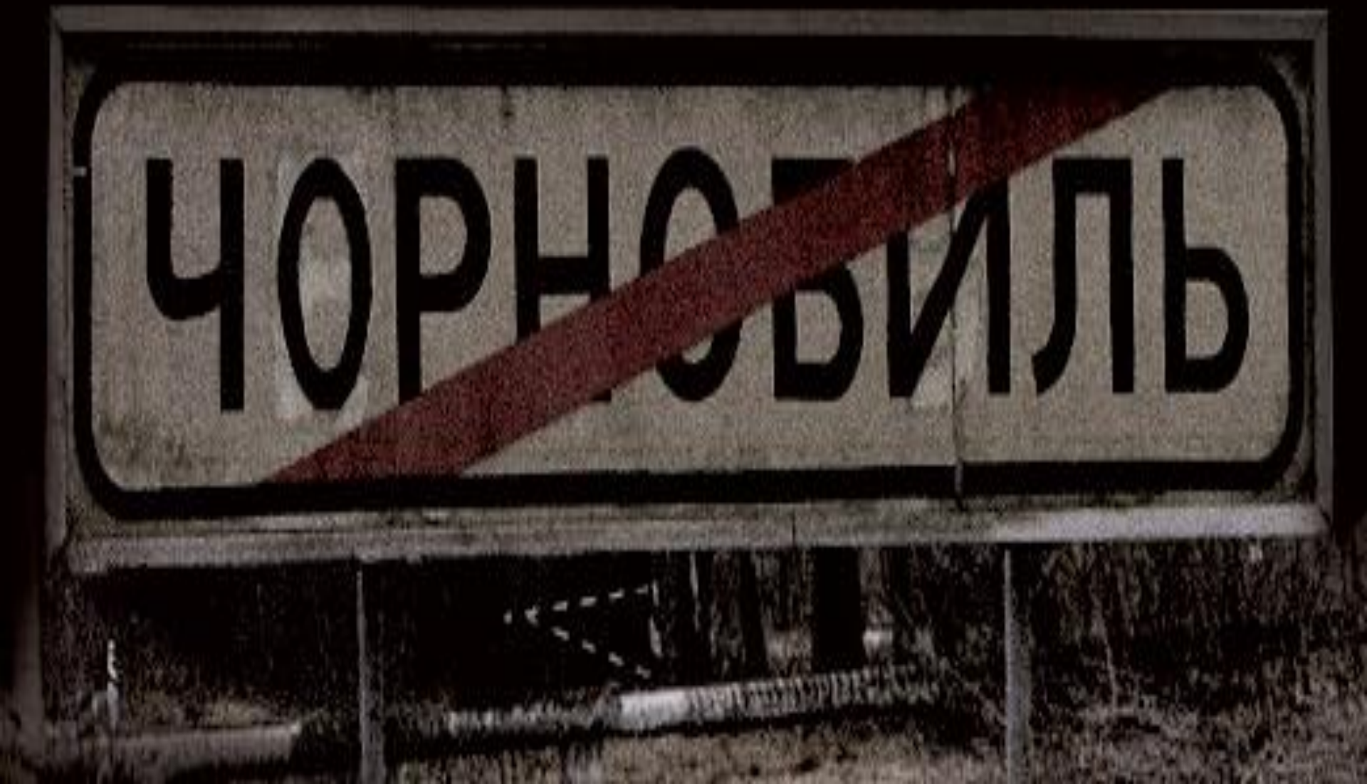
Чернобыль, город (с 1941 года) на Украине, Киевская область.