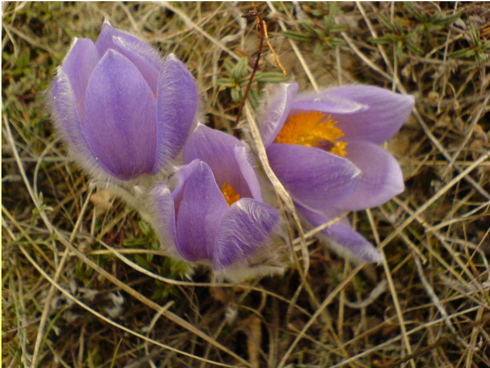
Прострел раскрытый (сон – трава)