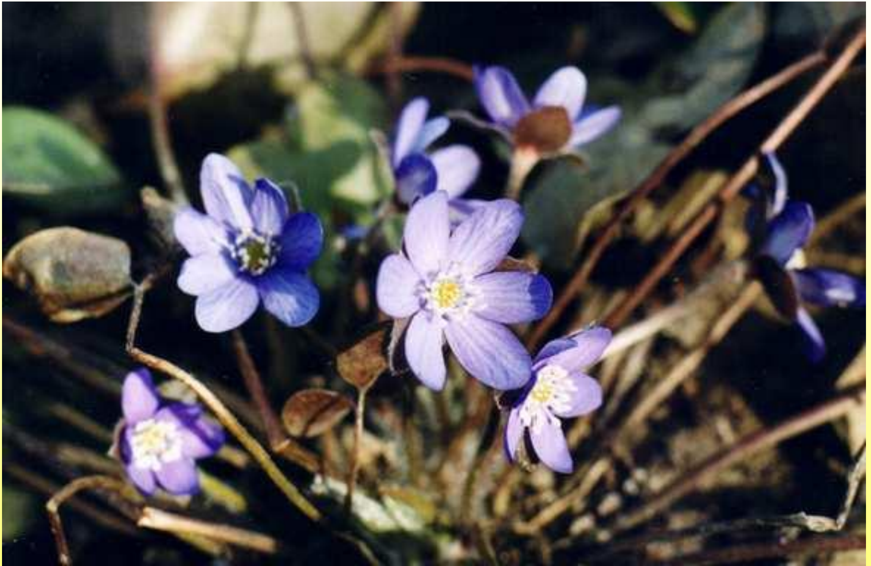
Печёночница благородная, или перелеска