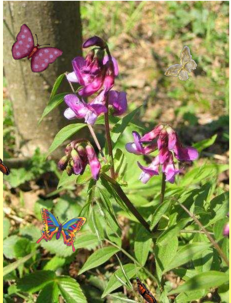
Сочевичник (чина весенняя)