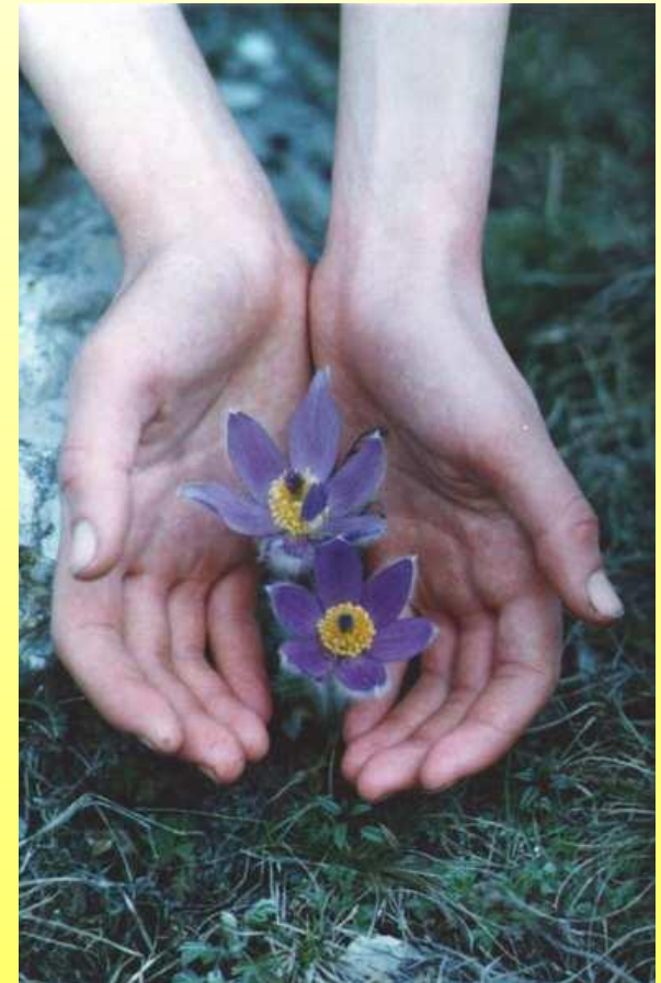
Прострел раскрытый (сон-трава)

Не успело солнце появиться, В земле его бутону не сидится. Голубовато - лиловые колокольчики раскрывает, Листья свои к свету не пускает. Народ верил, что он сон навевает, Людям радость и горе предвещает. Носит мохнатую шубу в холодную погоду, Не боится мороза и украшает природу.