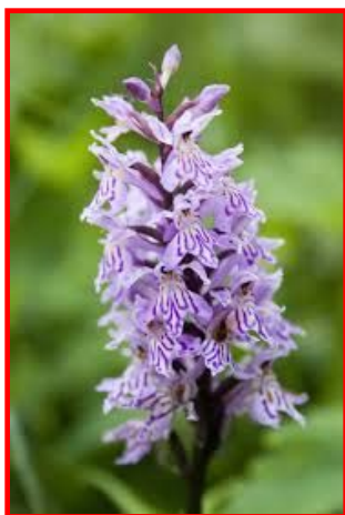
Орхидея пальчатокоренни К