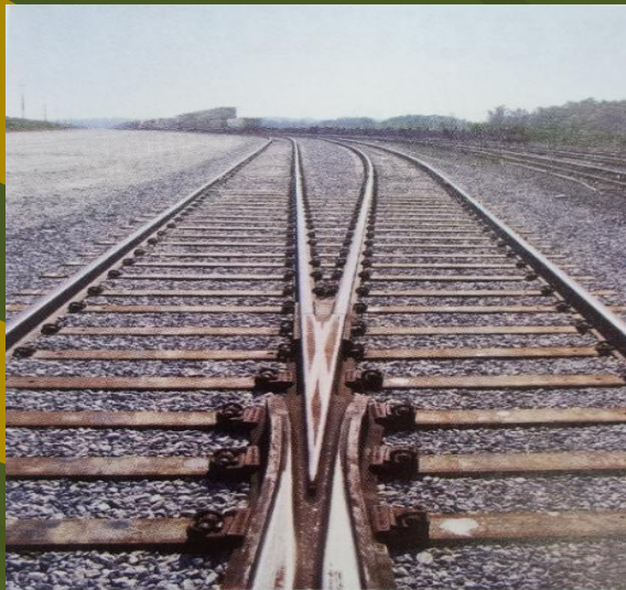
Рис. 3. Путь на стальных шпалах компании NARSTCO

Шпалы с точки зрения экологии // Железные дороги мира. -2011. - № 6. - С. 63-65.