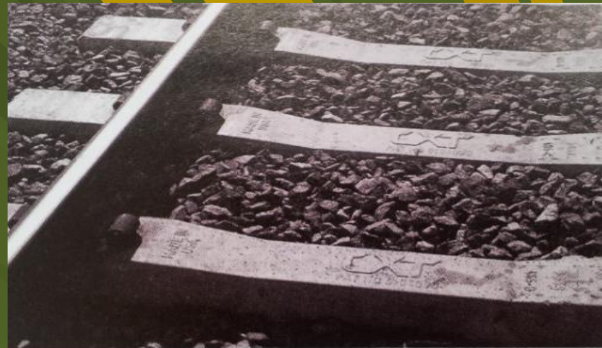
Рис. 1. Путь на железобетонных шпалах компании СХТ

Шпалы с точки зрения экологии // Железные дороги мира. -2011. - № 6. - С. 63-65.