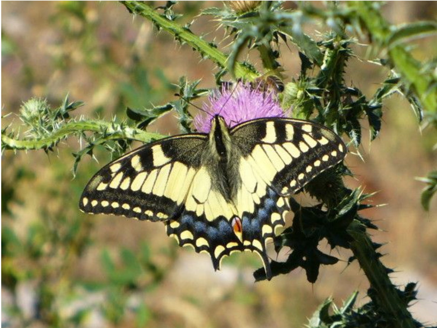
Я - бабочка-махаон из семейства Парусники