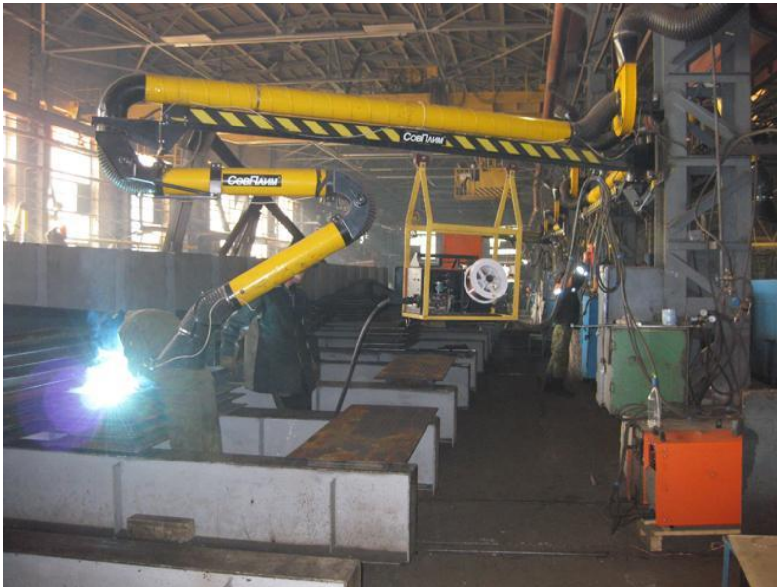
УЗМК ОАО «АК ВНЗМ»