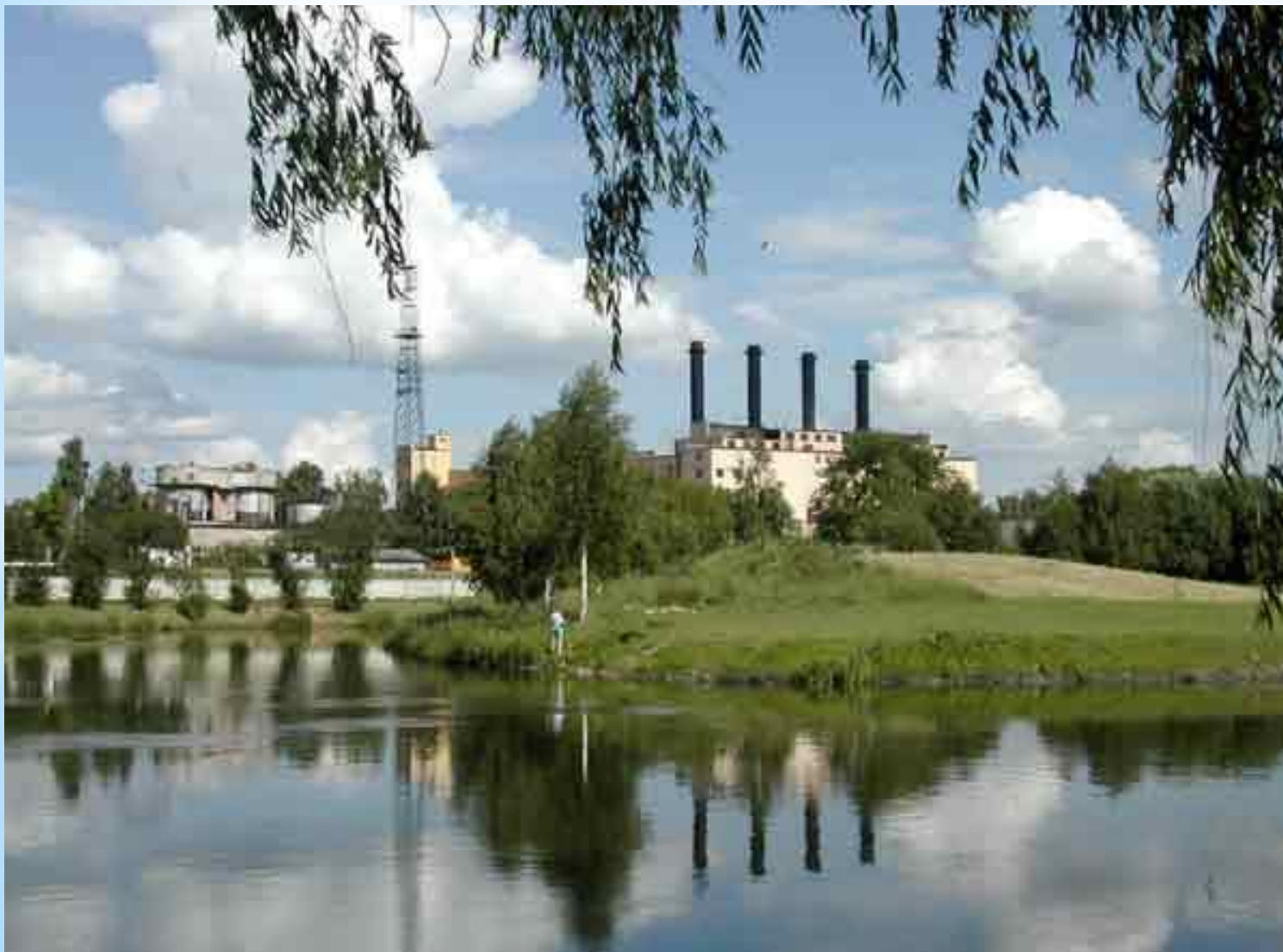
Водный бассейн ТЭЦ-2

* 2) для охраны водных объектов производственные сточные воды предприятий обезвреживают. Выпускают их по течению реки ниже района, используемого населением для водоснабжения и с оздоровительной целью;