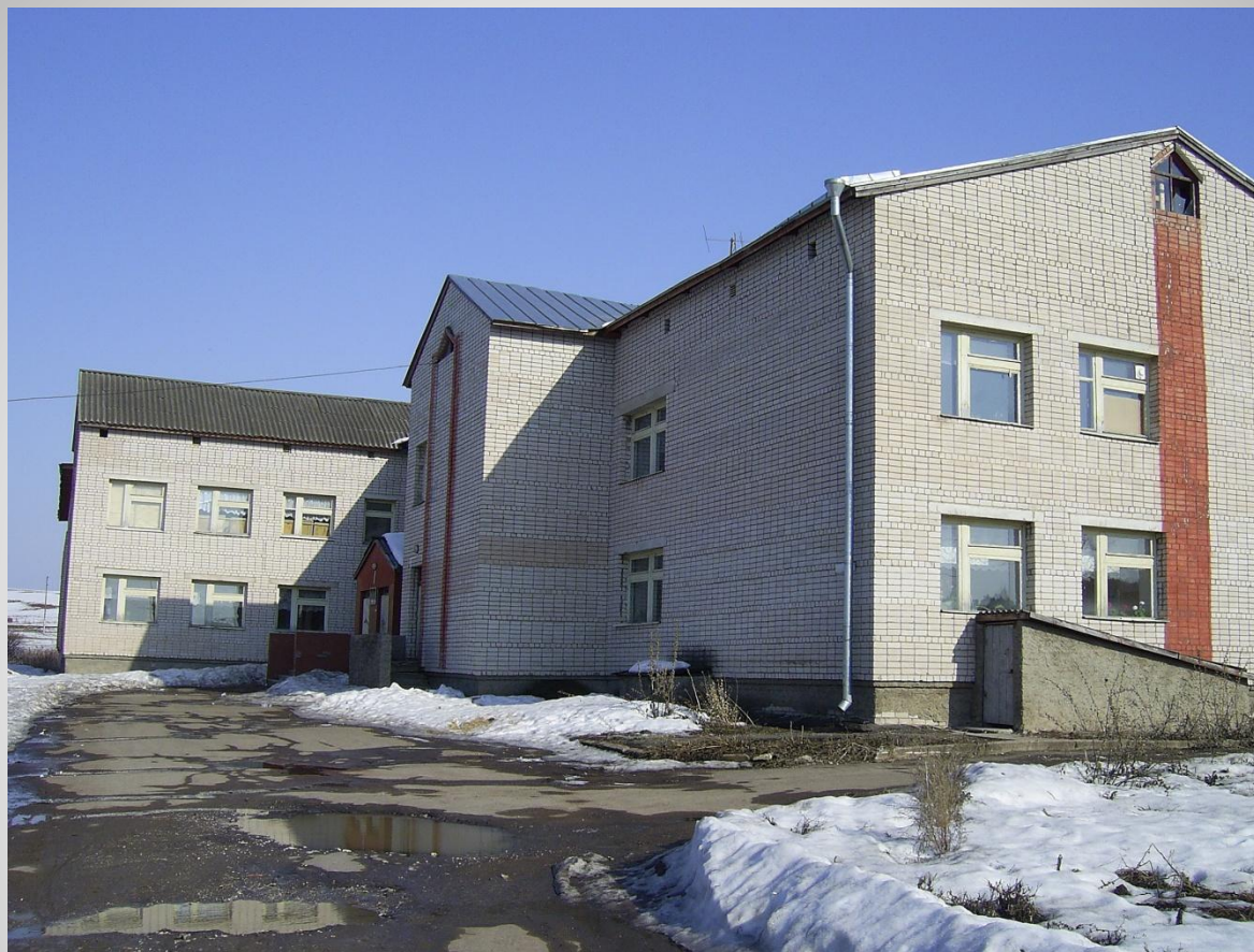
МОУ СОШ с.Бобино Слободского района Кировской области