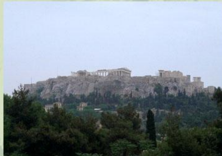
Афинский Акрополь - шедевр античной архитектуры.

Узнать об одном из древних «семи чудес света» - египетских пирамидах - вы сможете из статьи Египетские пирамиды .