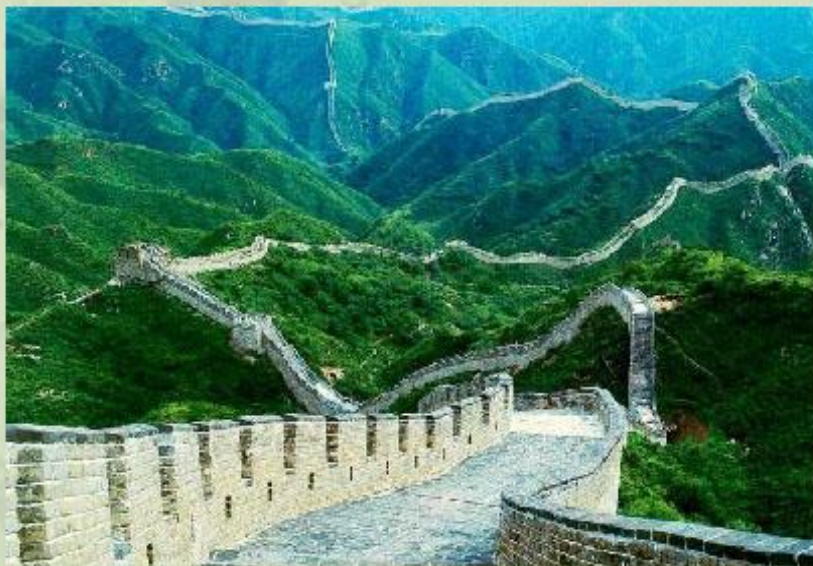
Великая Китайская стена.