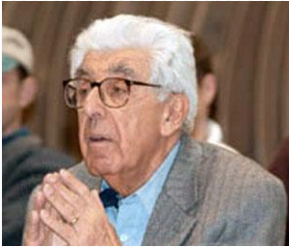
Барри Коммонер (1917) - американский эколог и биолог