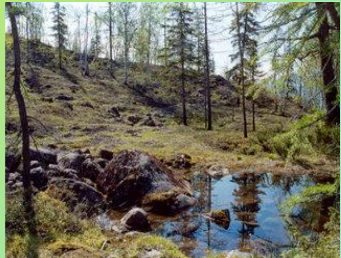
Самые северные в мире леса «Ары-Мас»