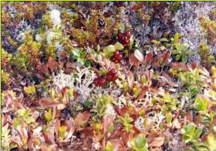
Растительность в тундре

На всей территории заповедника произрастает 429 видов сосудистых растений, 212 видов листостебельных мхов, 263 вида лишайников. Отмечено также 47 видов шляпочных грибов и 157 микромицетов.