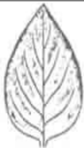
Тип «Рыбьего скелета»