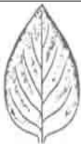
Тип «Рыбьего скелета»