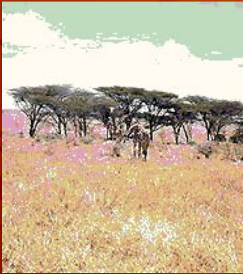
Человек в тропиках