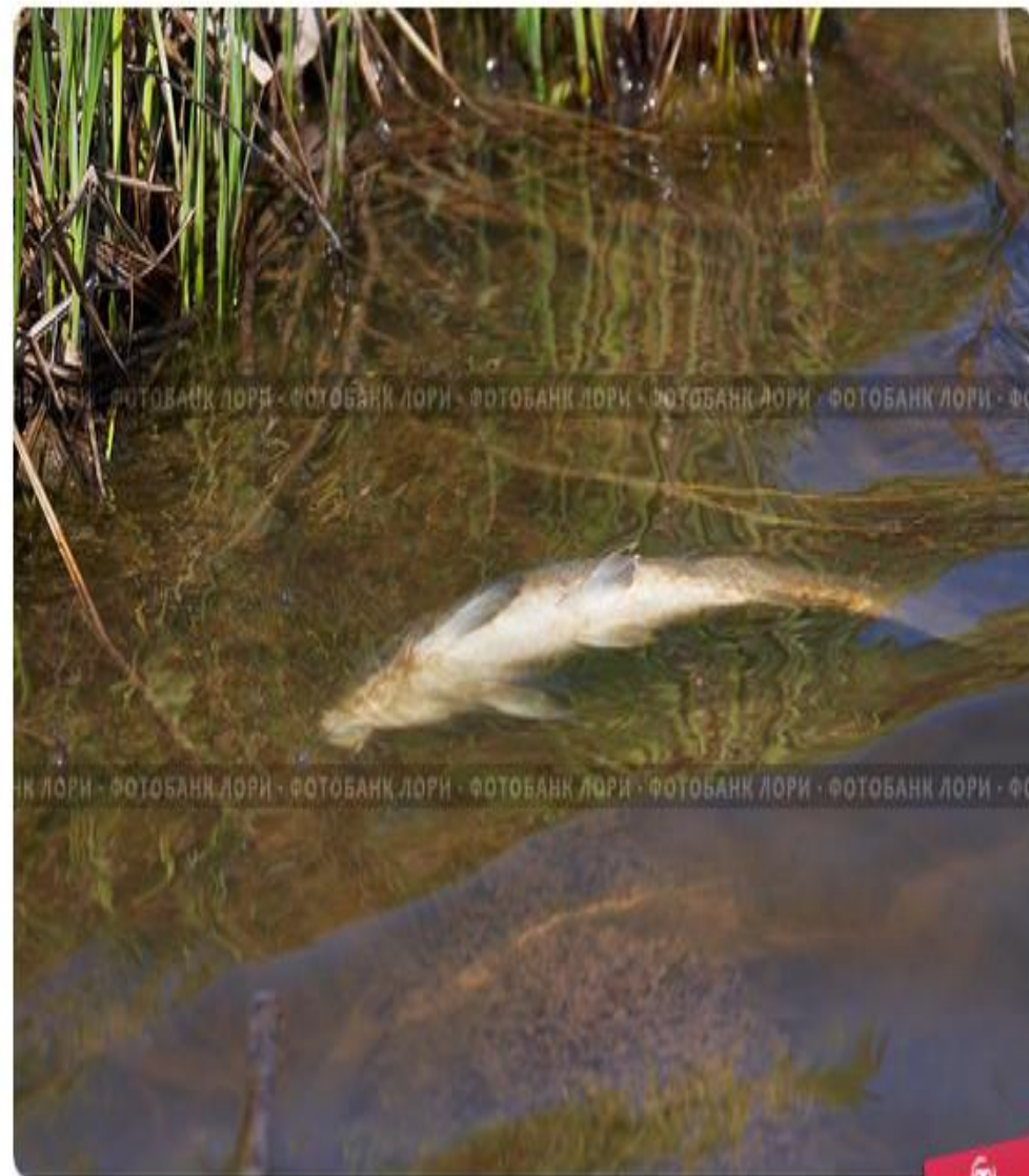
Мертвая рыба - экологическая катастрофа

Такие суда представляют реальную опасность для экологии Волги и ее притоков, поскольку в них есть остатки топлива, в аккумуляторах – кислота, которые вымываются течением. Негативное воздействие оказывают и коррозионные процессы. Кроме того, некоторые суда затонули с остатками грузов, зачастую это ядохимикаты, которые со временем попадают в воду. Большинство из этих судов затонули в 1990-е годы прошлого столетия, и их собственников сейчас найти сложно. Но те судовладельцы, которых удается найти, оплачивают работы по подъему, но не очень охотно.