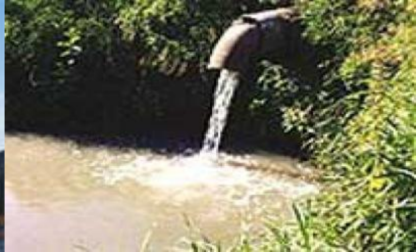
Сток промышленных отходов