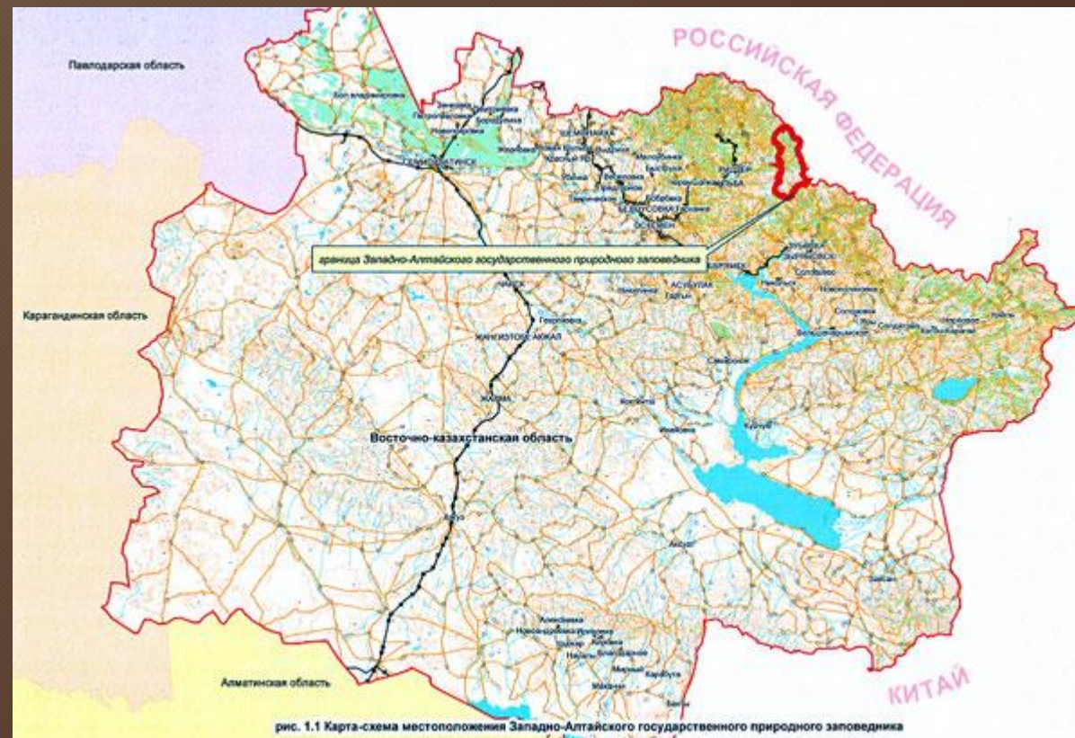
рис. 1.1 Карта-схема местоположения Западно-Алтайского государственного природного заповедника