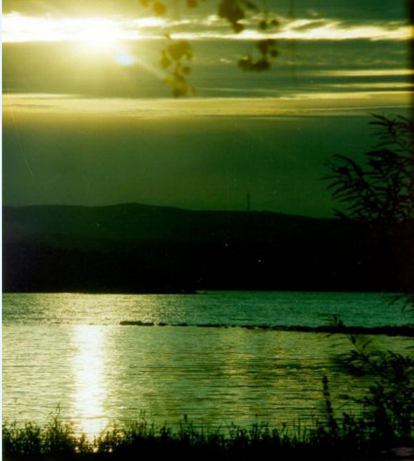
Озеро Большой Кисегач