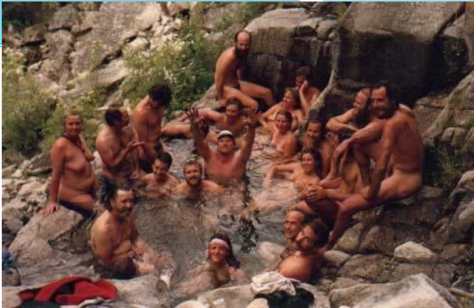
Earth First! board meeting, River of No Return, Montana 1987 Засідання правління організації на тему: «Річка немає повернення»