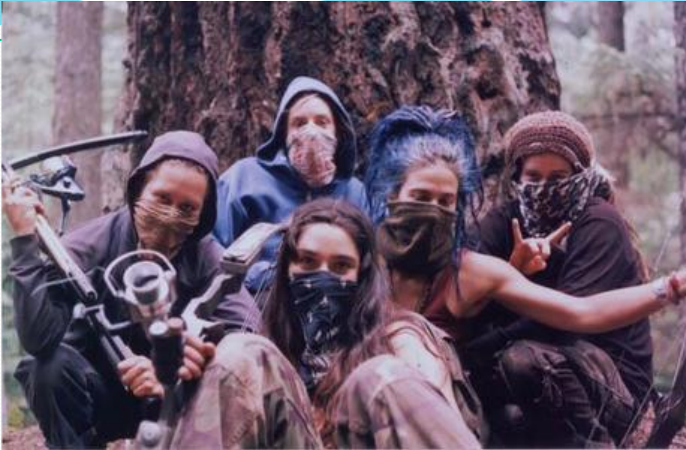
The Womyn's action group poses for a photo at the 2004 Straw Devil Action Camp in the Willamette National Forest. This camp is seen as the origin of TWAC