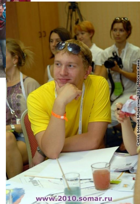
Съезд Боевой Маркетинг 2010, Москва-Киев