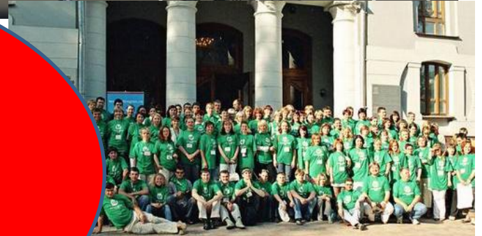
VI Всероссийский Съезд • ВТЛ-2005 • 15-17 июля, г. Самара