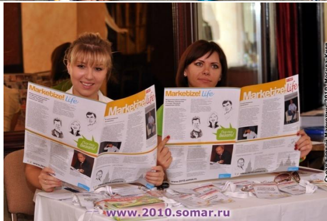
Съезд Боевой Маркетинг 2010, Москва-Киев