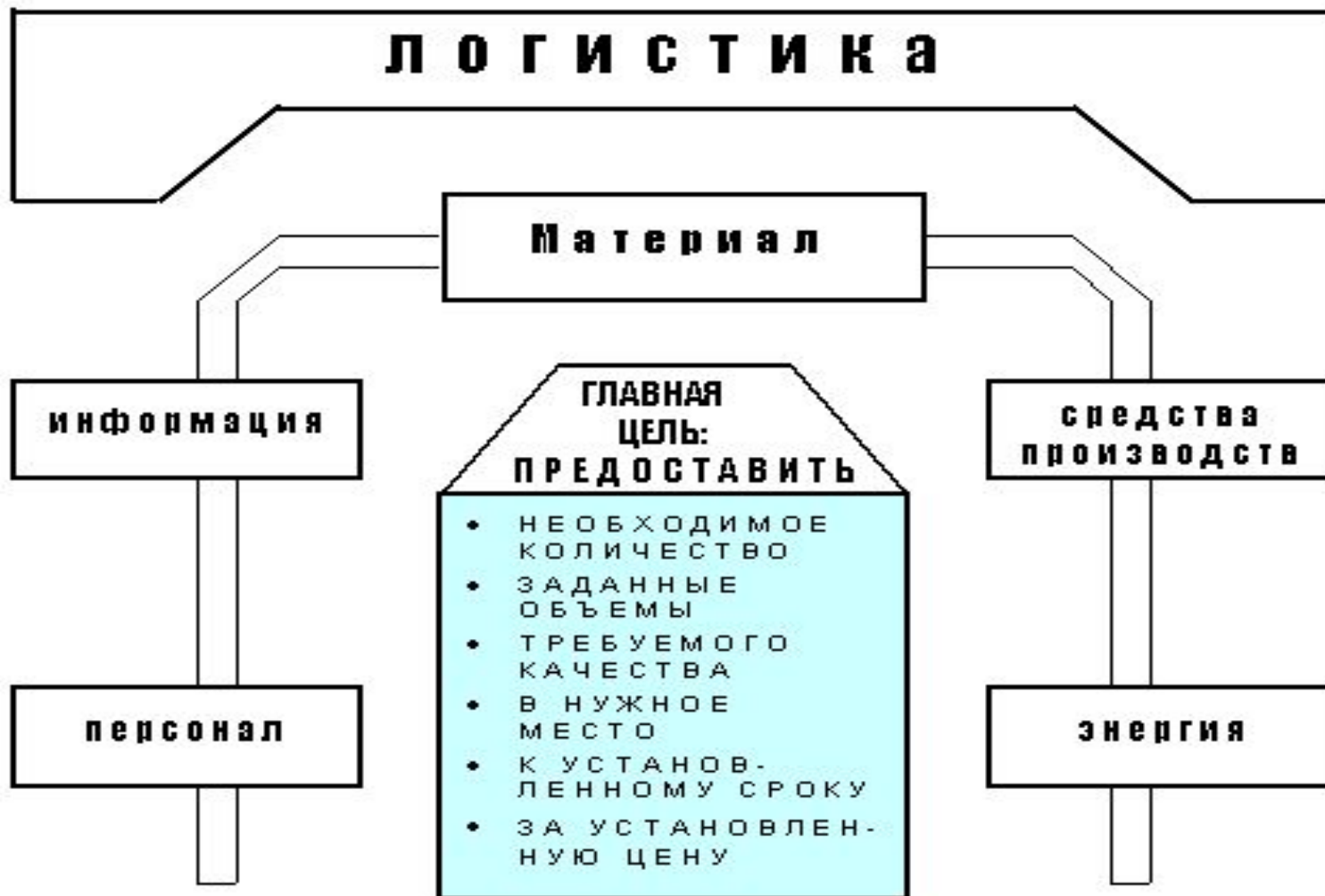
Рис . 2. Общепринятые цели логистической деятельности Шесть правил логистики (6 richtig)