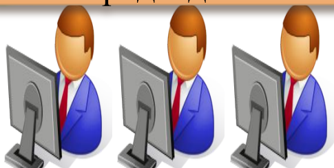
Члены конкурсной комиссии