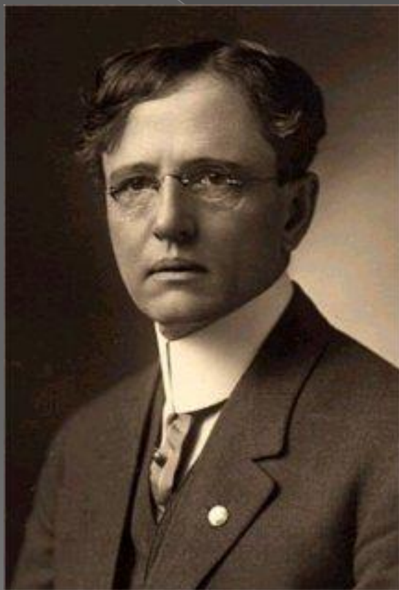
Джон Коммонс (1862–1945)