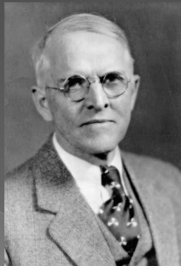
Уэсли Митчелл (1874–1948).