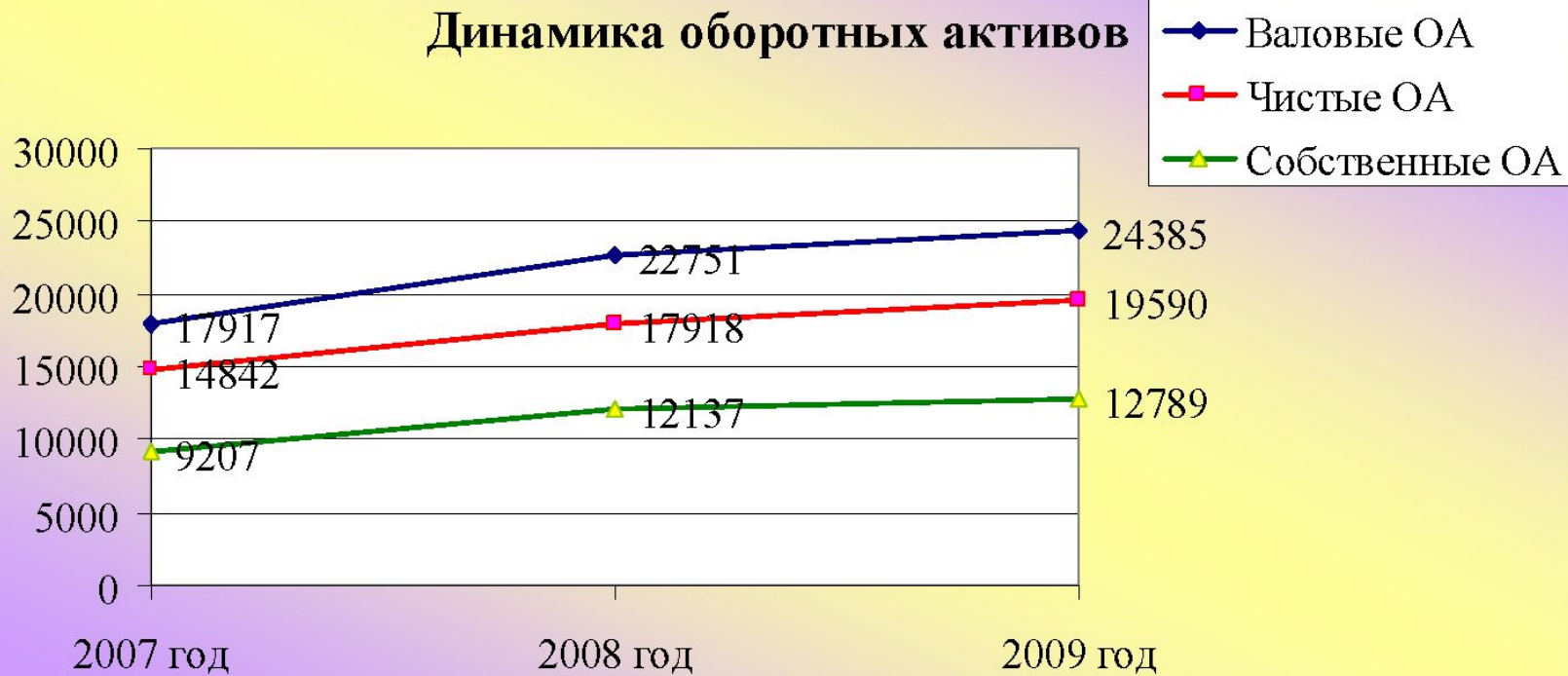
Рис.1. Динамика оборотных активов ОАО «Ярославский хлебозавод №4» с 2007 по 2009 г.