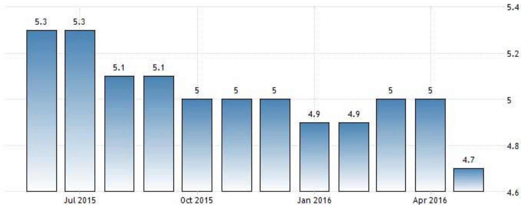
US UNEMPLOYMENT RATE