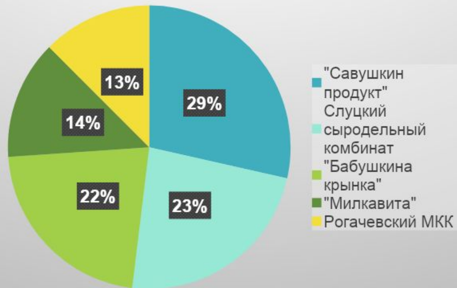
Доля предприятий молочной продукции РБ (топ 5)

Так как 1800 < HII < 10000 , то данный рынок является высококонцентрированным