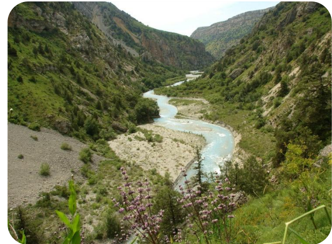
Ақсу-Жабағылы мемлекеттік табиғи қорығы

Қазақстанда қазіргі уақытта 10 қорық ұйымдастырылған. Қазақстандағы қорықтардың барлық ауданы 1 610 973 га.