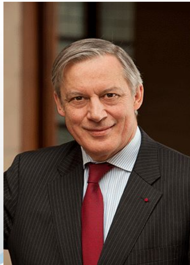
Председатель Совета директоров Кристиан Нойер, Париж