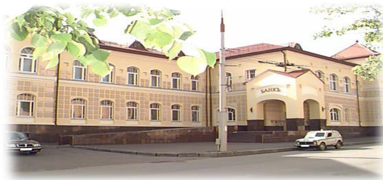
РКЦ г. Рыбинск

Проводят расчетно-кассовое обслуживание коммерческих банков, местной администрации, а также бюджетных организаций (милиции, воинских частей, МЧС, школ, детских садиков и др.)