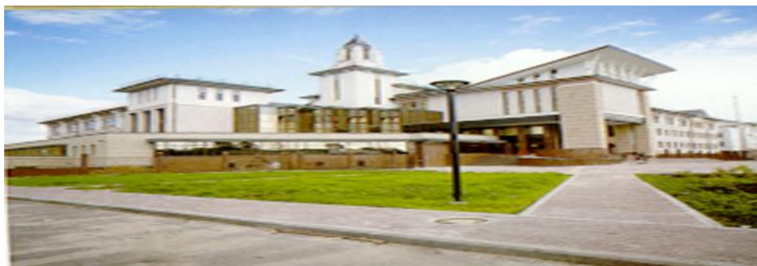
ГРКЦ Вологодской обл.

Проводят расчетно-кассовое обслуживание коммерческих банков, администрации области, мэрии, а также бюджетных организаций (милиции, воинских частей, МЧС, и др.)