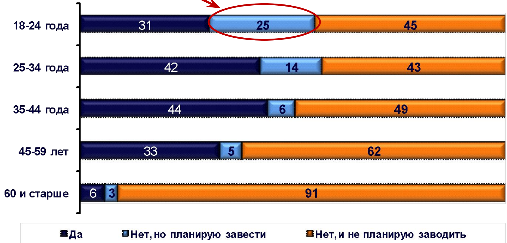
У Вас есть банковская (пластиковая) карта? % по возрасту