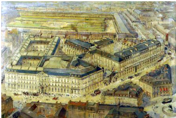
Перший Французський банк

БАНКИ ВИНИКЛИ В СЕРЕДНЬОВІЧЧІ НА ОСНОВІ КОНТОР МІНЯЙЛІВ ТА МАЙСТЕРЕНЬ І КРАМНИЦЬ ЮВЕЛІРІВ (ФЛОРЕНЦІЯ, АМСТЕРДАМ, ВЕНЕЦІЯ).