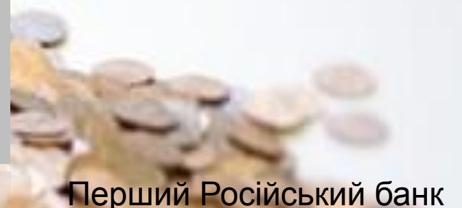
Перший Російський банк

БАНКИ ВИНИКЛИ В СЕРЕДНЬОВІЧЧІ НА ОСНОВІ КОНТОР МІНЯЙЛІВ ТА МАЙСТЕРЕНЬ І КРАМНИЦЬ ЮВЕЛІРІВ (ФЛОРЕНЦІЯ, АМСТЕРДАМ, ВЕНЕЦІЯ).