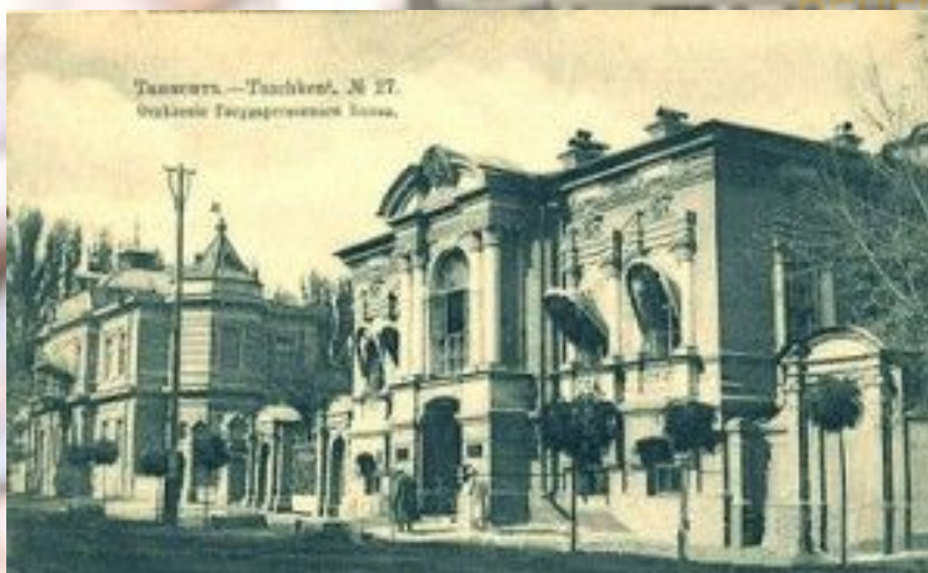
Перший Великобританський банк