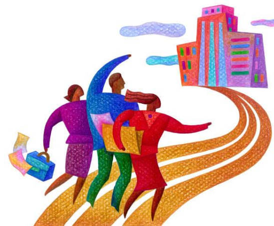
Команда. Трудовые ресурсы