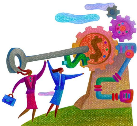
Использование заемных средств