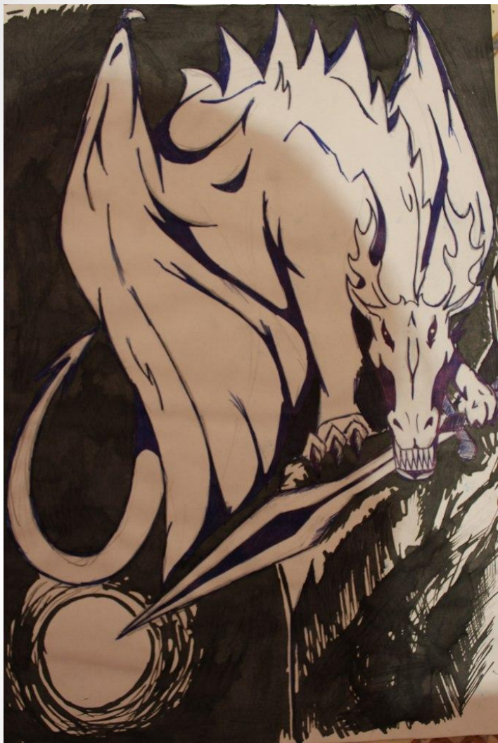
Автор – Чернова Е.