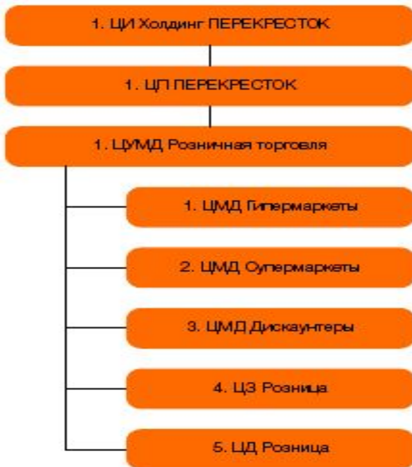
а) сеть «Перекресток»