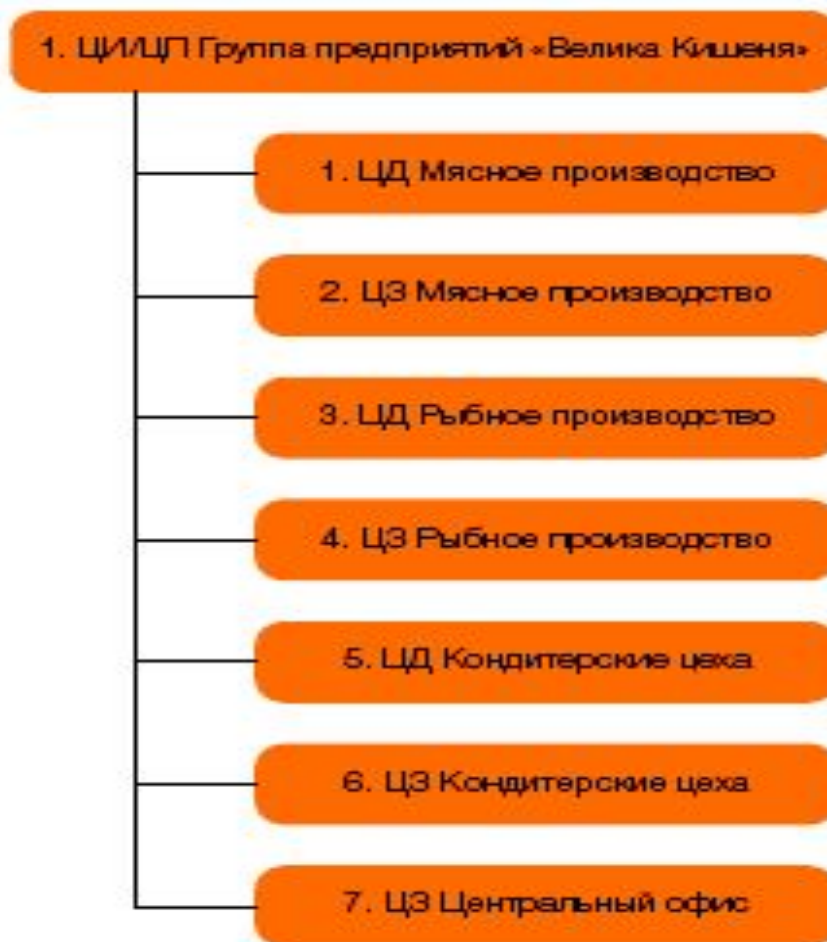
б) сеть «Велика Кишеня»

Условные обозначения (здесь и далее): ЦИ – центр инвестиций; ЦП – центр прибыли; ЦУМД – центр учета маржинального дохода; ЦЗ – центр затрат; ЦД – центр доходов.