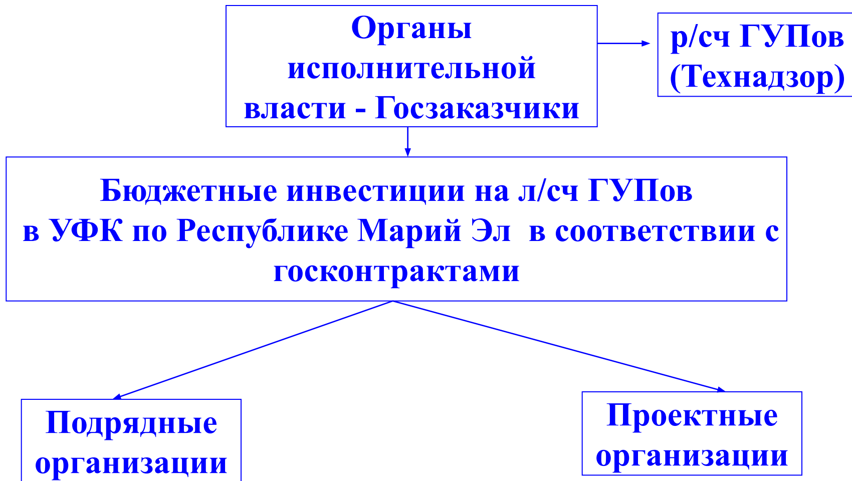
Схема финансирования бюджетных инвестиций, действовавшая до 1 июля 2012 года