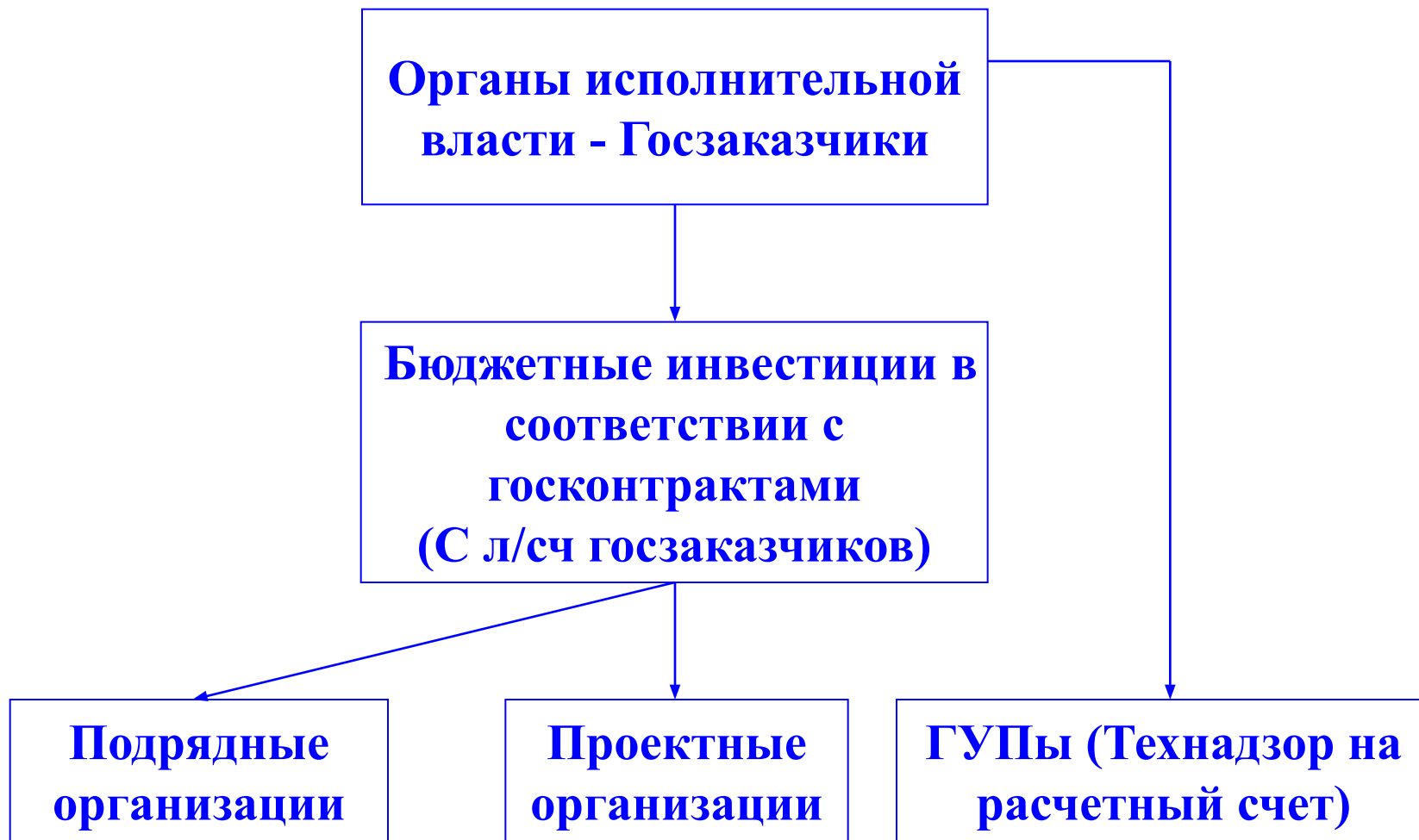
Схема финансирования бюджетных инвестиций, действующая с 1 июля 2012 года