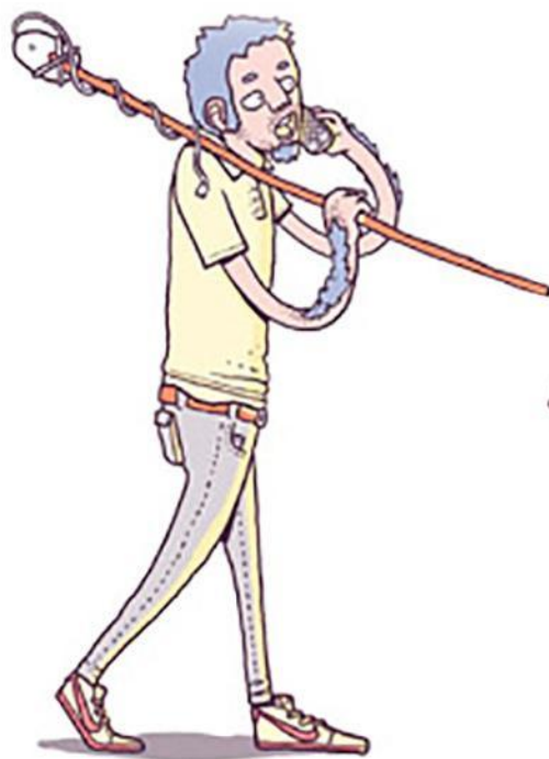
Сайты сравнения кредитов