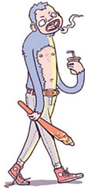
Арбитраж через сайт-прокладку