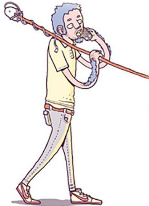
Сайты сравнения кредитов