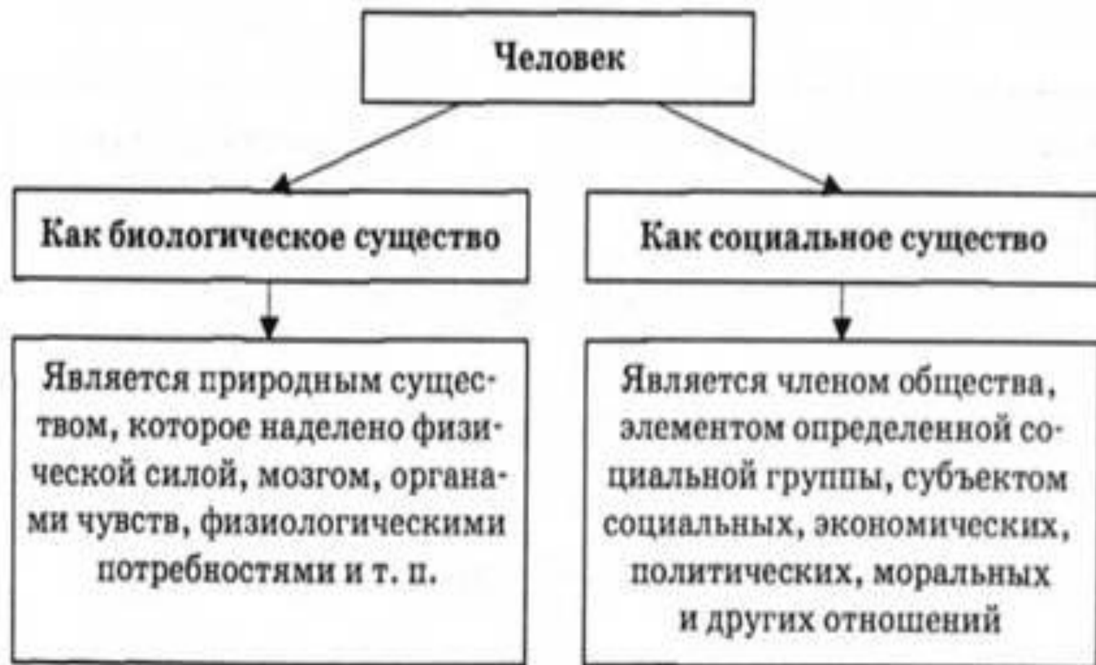
Рис. 3.14. Биосоциальные черты человека