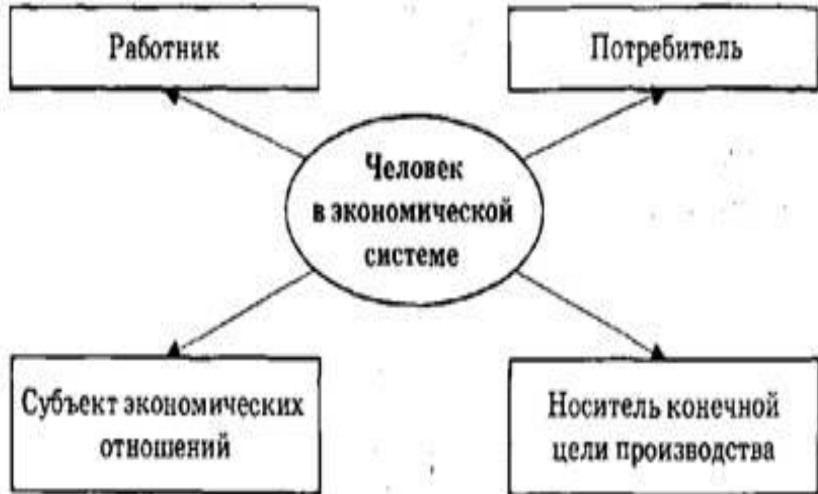
Рис. 3.15. Место человека в экономической системе