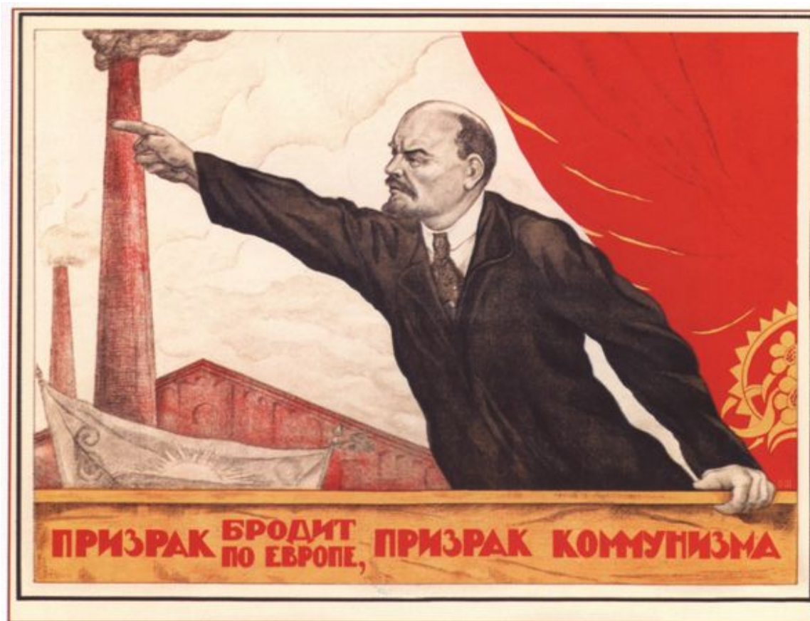
78. Щербаков В. Призрак бродит по Европе, призрак коммунизма. 1920-е гг.