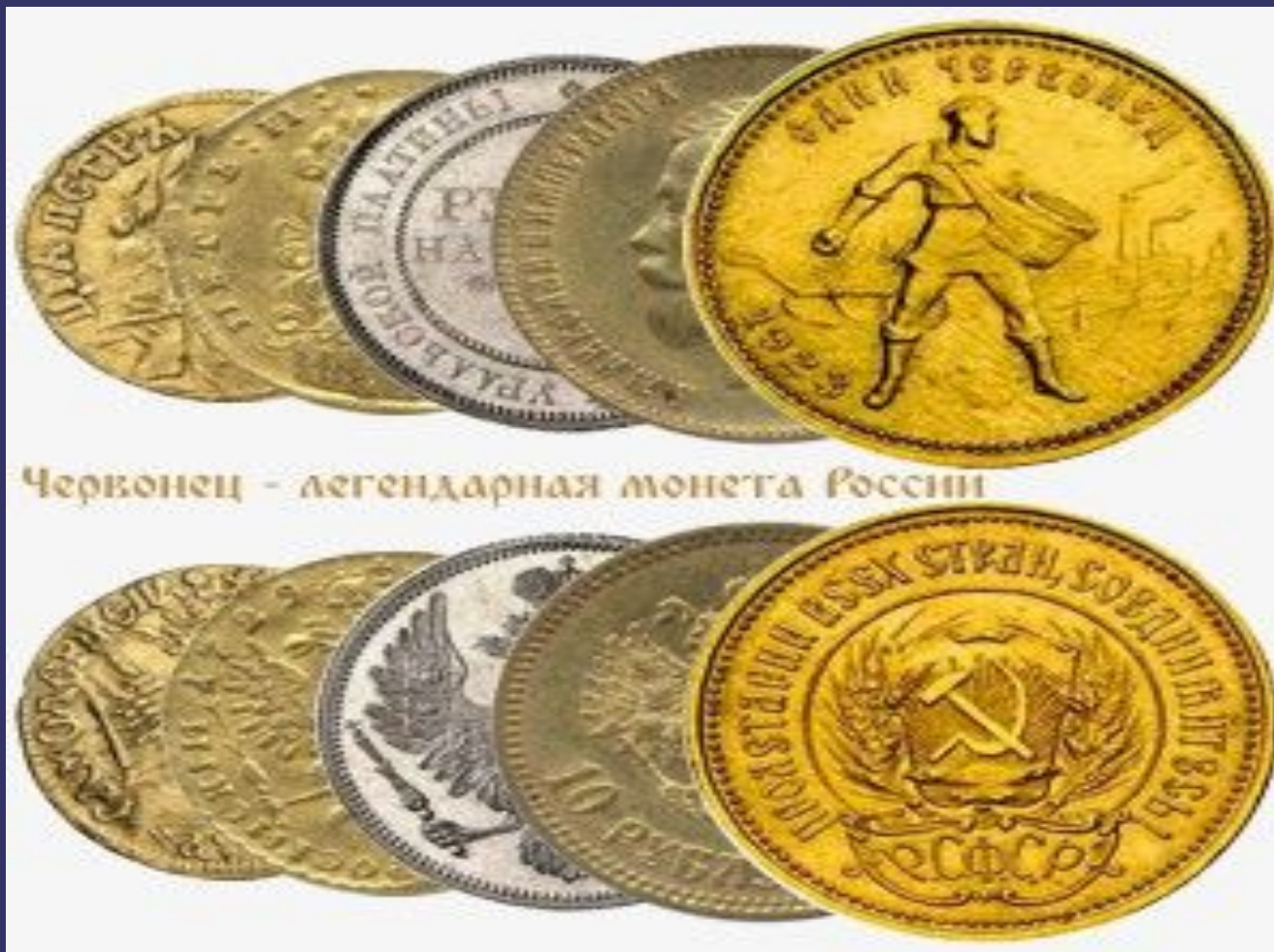
Червонец - легендарная монета России