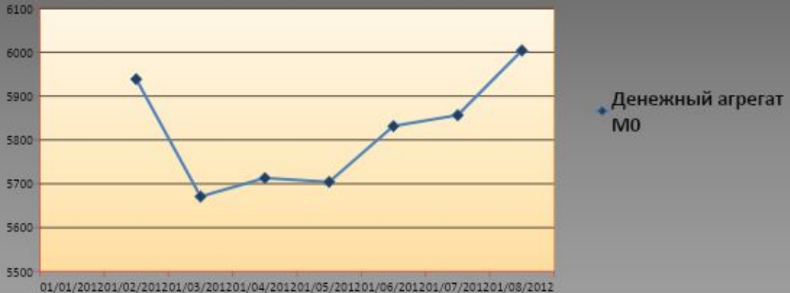
Динамика денежного агрегата M_0