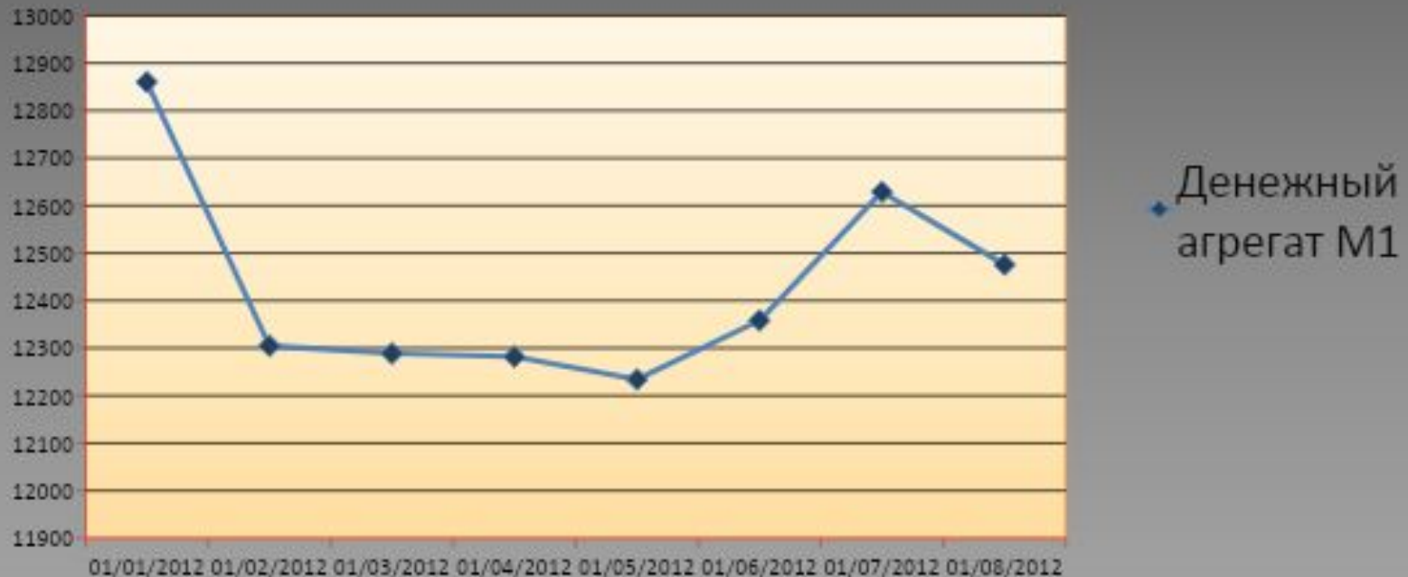
Динамика денежного агрегата M_1