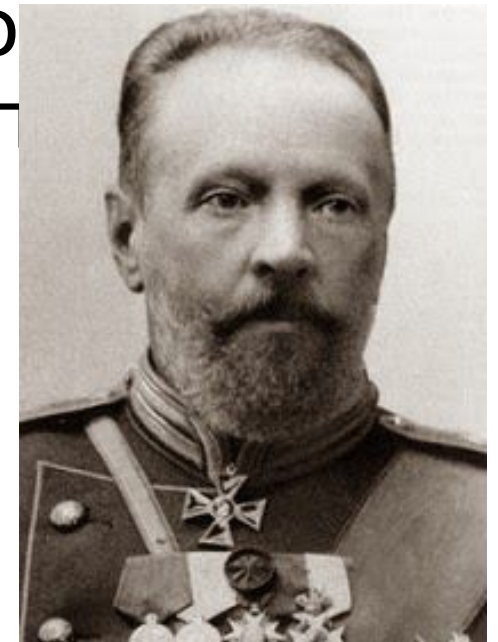
Витте Сергей Юльевич (1849-1915)

Этот период в финансовой истории России называется периодом золотого монометаллизма.