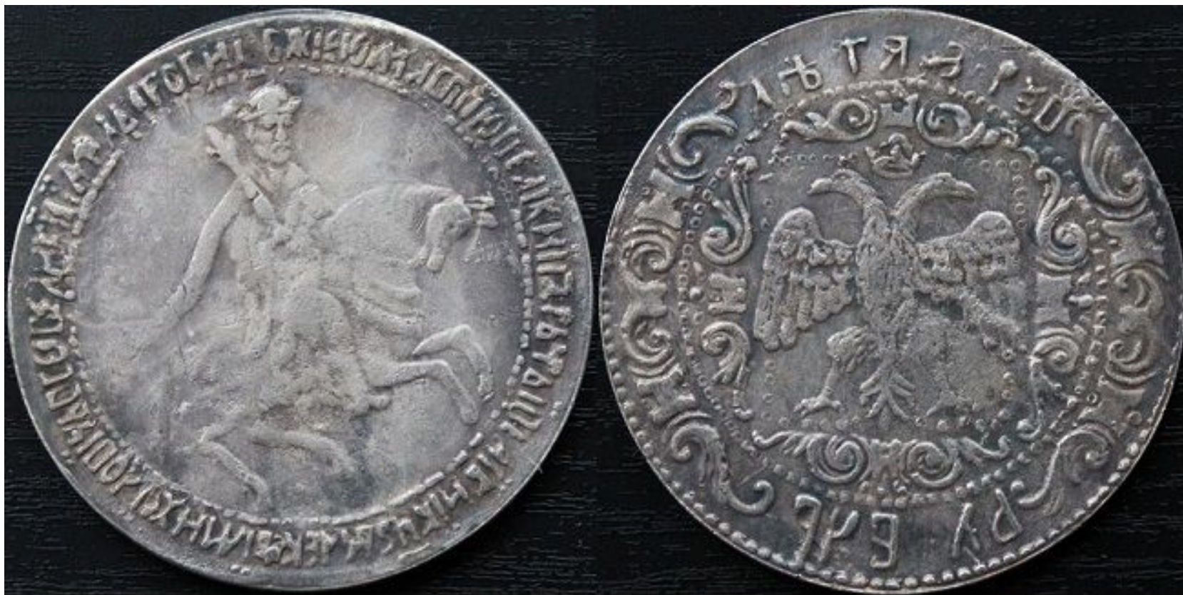
Рубль Алексея Михайловича (1654)