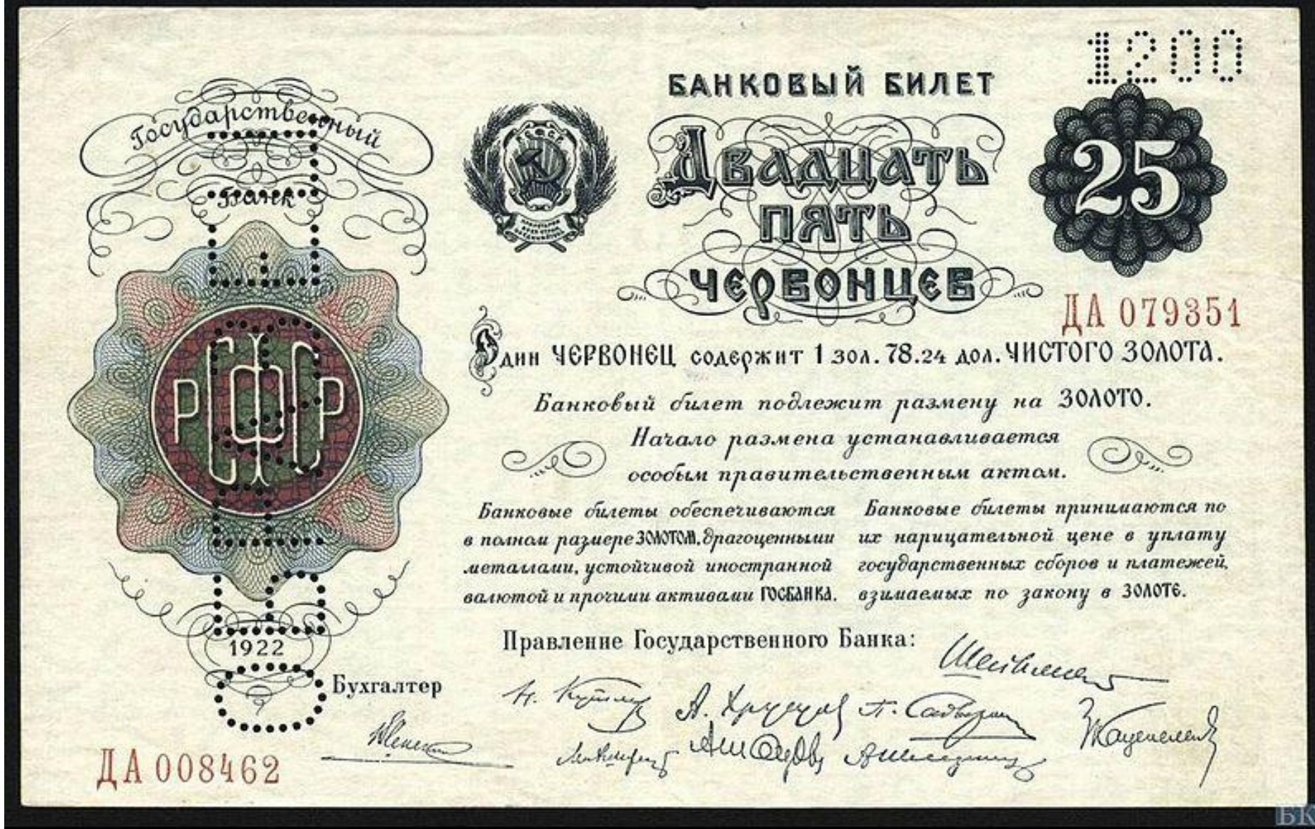
25 червонцев 1922 — самая крупная купюра, «содержащая» 193,5 г чистого золота