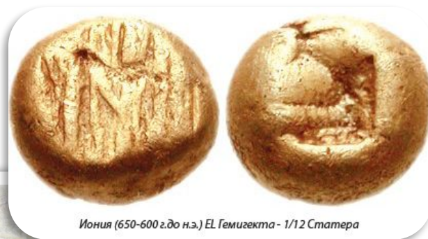
Иония (650-600 г.до н.э.) EL Гемизекта - 1/12 Статера