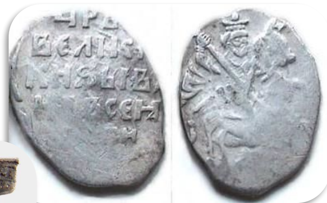
Копейка с 1554г.