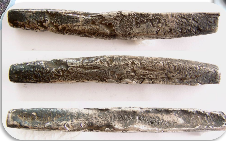
Новгородский серебряный рубль (гривна)