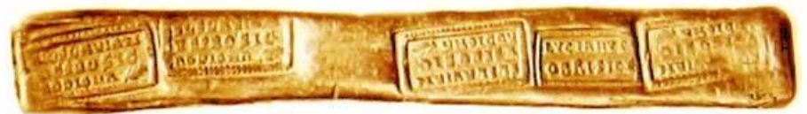
Заготовка для монет.