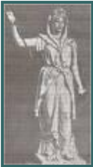
Статуя Юноны Монеты