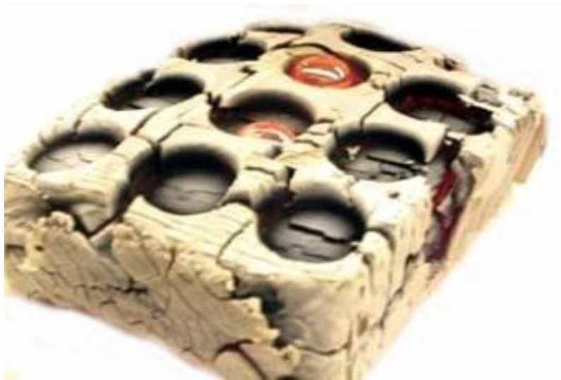
Форма для ОТЛИВКИ МОНЕТ