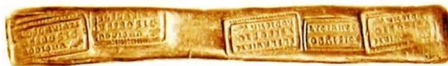
Заготовка для монет.