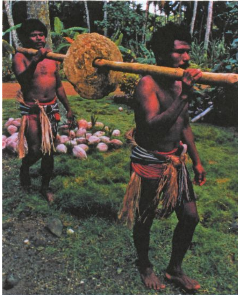
Транспортировка каменных денег на острове Ял в Тихом океане.