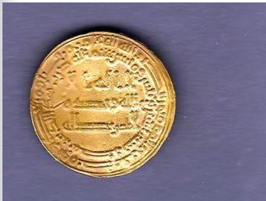
Старинный золотой динар