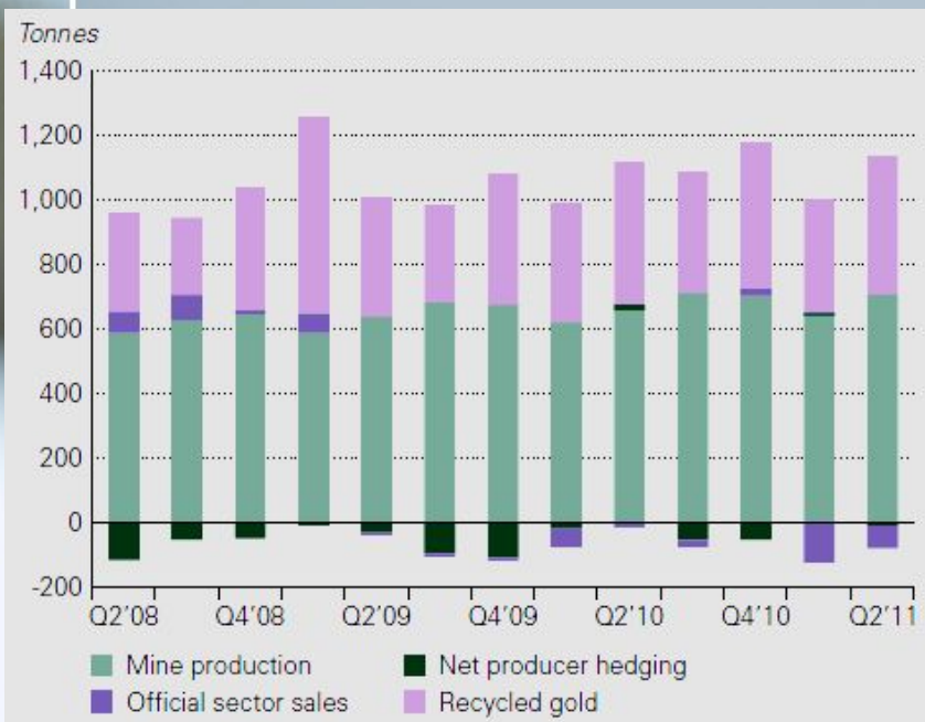
Предложение золота (в тоннах)

Первая пятерка стран добычи золота (2010 год):