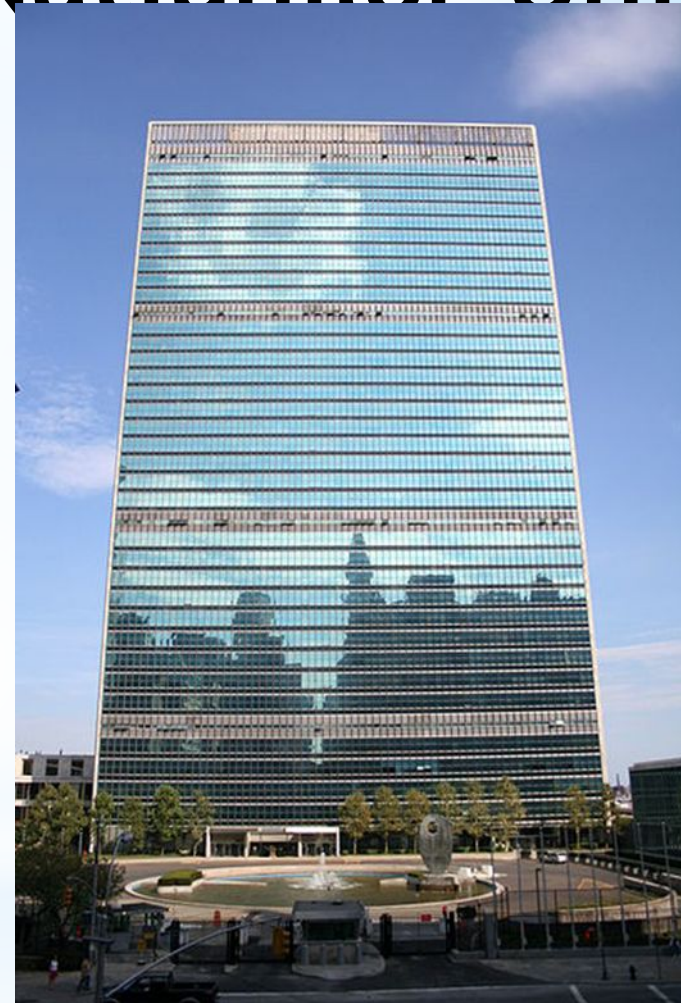
Sediul ONU din New York