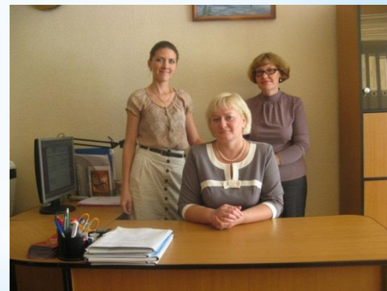
Специалисты по учебно-методической работе: