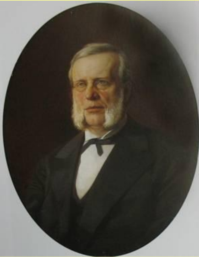
Вышнеградский Иван Алексеевич (1830–1895), министр финансов в 1886–1892 гг.

Ради пополнения казны Вышнеградский поощрял экспорт хлеба: