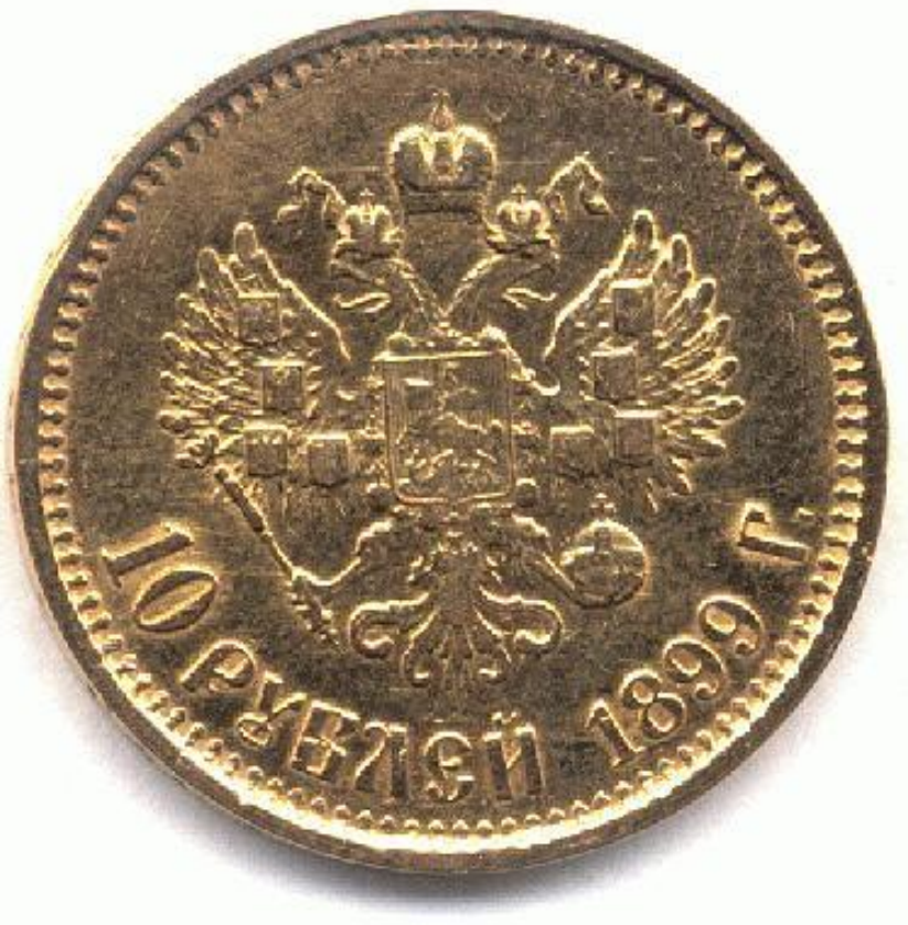
10-рублевая монета (червонец) 1899 г.

1897 г. – денежная реформа. Установлен свободный обмен рубля на золото (золотой стандарт).