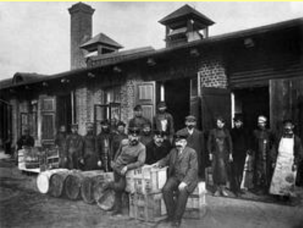
Казенный винный склад. Группа администрации с рабочими. Нижний Новгород. 1890-е гг.

С 1894 г. продажа спирта, водки и крепких вин объявлена монополией государства.