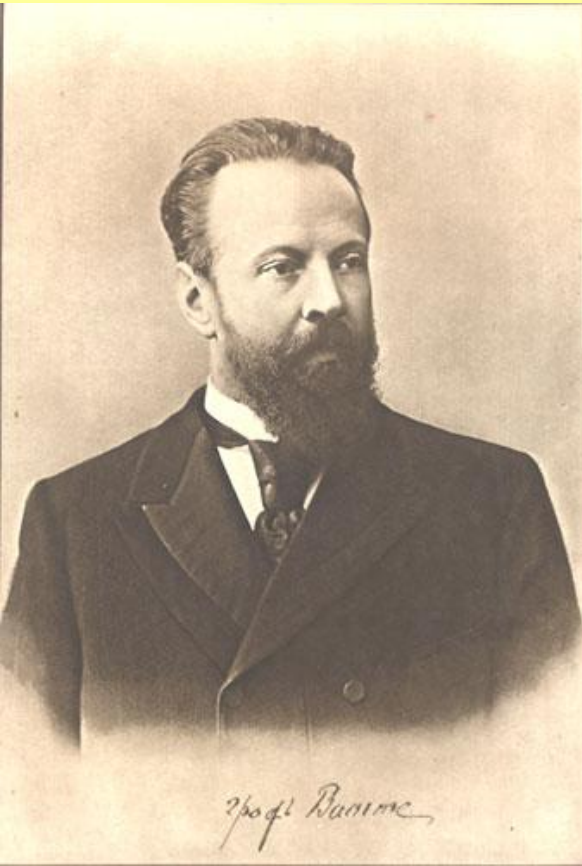
С.Ю. Витте, министр финансов.

В 1889 г. Витте назначен директором Департамента железнодорожных дел Министерства финансов, в феврале 1892 г. – управляющим Министерством путей сообщения, в августе 1892 г. – министром финансов. В 1-й половине 1880-х гг. Витте, будучи сторонником славянофильских взглядов, возражал против «обращения хотя бы части русского народа в несчастных рабов капитала машин».