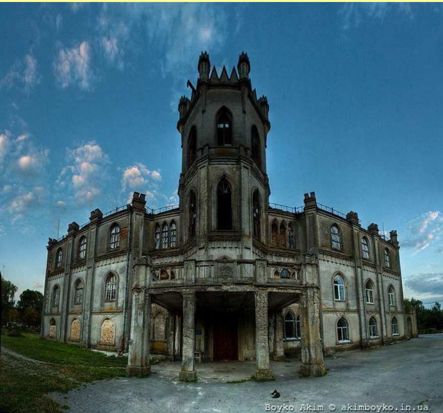
Дворец сахарозаводчика Ф. Терещенко в местечке Червоное под Житомиром.

Синдикат сахарозаводчиков ввел «нормировку» для каждого завода с обязательством продавать весь произведенный сверх нормы сахар за границей. В Европе русский сахар стоил 2 р.08. коп./пуд, а в России — 15 коп./пуд.