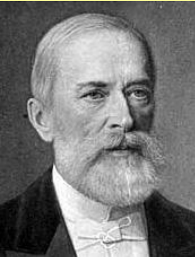
Николай Христианович Бунге (1823–), министр финансов в 1881–1886 гг.

Подход Бунге к рабочему вопросу: «сила и влияние господствующих классов могут быть прочно основаны лишь на благосостоянии рабочего сословия».