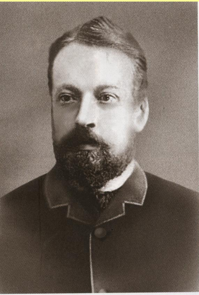
Сергей Юльевич Витте (1849–1915)

В 1892 г. вместо заболевшего Вышнеградского министром финансов стал С.Ю. Витте .