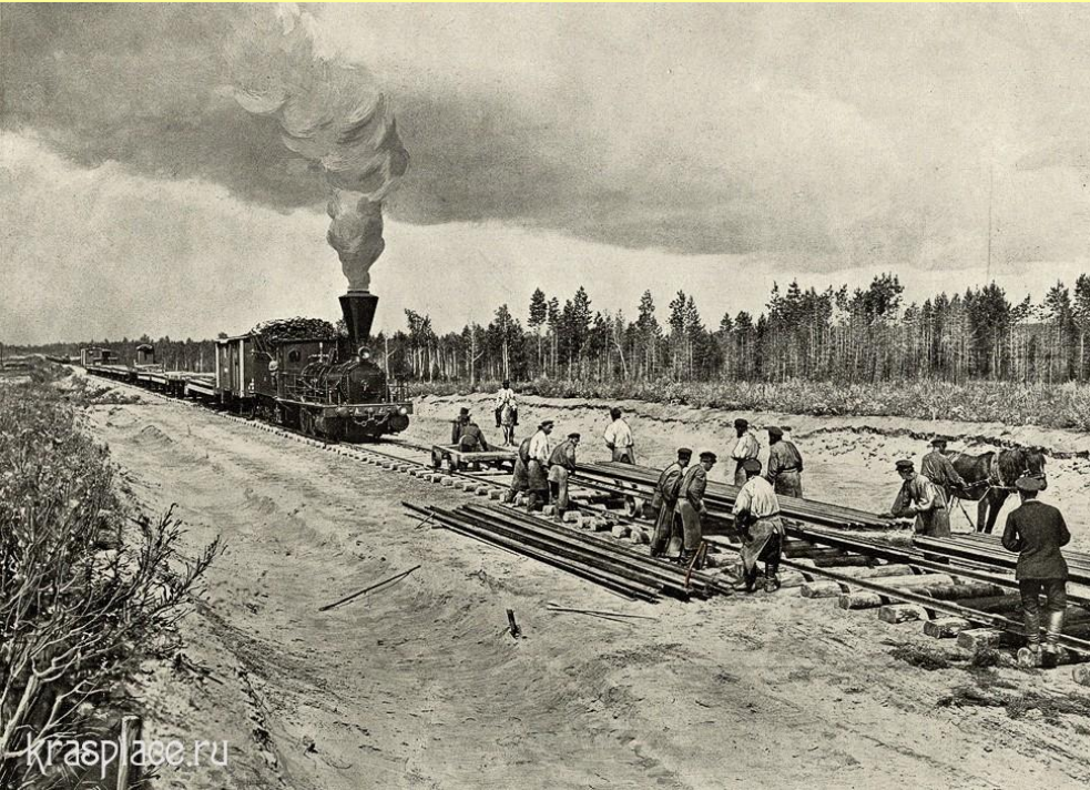
Строительство Транссибирской магистрали

В 1891 г. началось строительство Транссибирской магистрали, не имевшее в мире аналогов по протяженности пути, размаху и сложности работ.