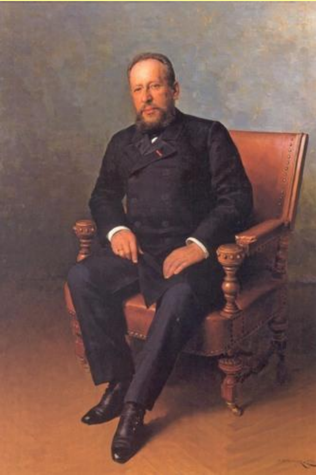
Лазарь Бродский, один из основателей синдиката сахарозаводчиков

Следствие концентрации производства – возникновение монополий.