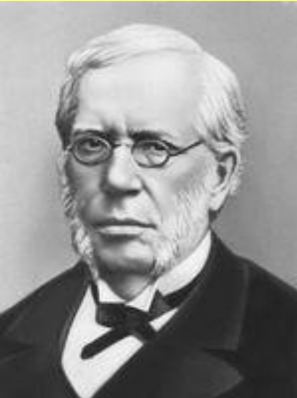
Вышнеградский Иван Алексеевич (1830–1895), министр финансов в 1886–1892 гг.

Известный ученый-механик. Одновременно – крупный делец. 1890 г. – сокращение полномочий фабричной инспекции, разрешение ночного труда женщин и подростков, найма на работу детей с 10 лет. 1889 г. – закон, ограничивший переселение крестьян на окраины.